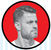
مرتضی پورعلی گنجی:

ستاره تیم ملی ولز عنوان کرد که این تیم احساس خیلی بدی بعد از بازی با ایران دارد و شرایط صعود حالا سخت شد. گرت بیل می‌گوید: «ما له شدیم، هیچ کلمه بهتری برای گفتن شرایطمان بعد از این دیدار نیست. باید ریکاوری کنیم و تلاش کنیم که دوباره برگردیم. مطمئناً الان کسب جواز صعود به دور بعد دشوار خواهد بود و به بازی دیگر گروه بستگی دارد.»