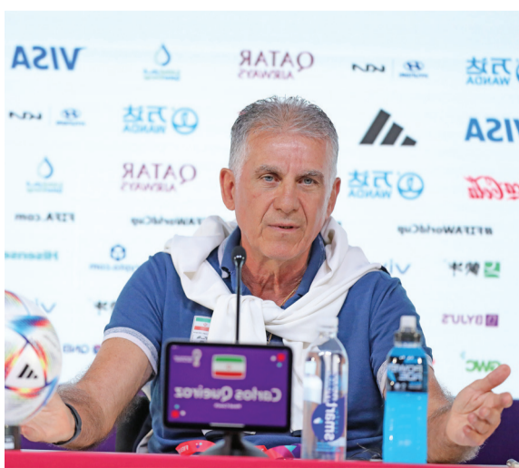
کارلوس کی‌روش در نشست خبری

۴- در تمام دنیا رسانه‌ها با فوتبالیست‌ها ارتباط دارند و بخشی از کار رسانه‌ای، رسیدن به اخباری است که برای مخاطب جذاب است. وقتی