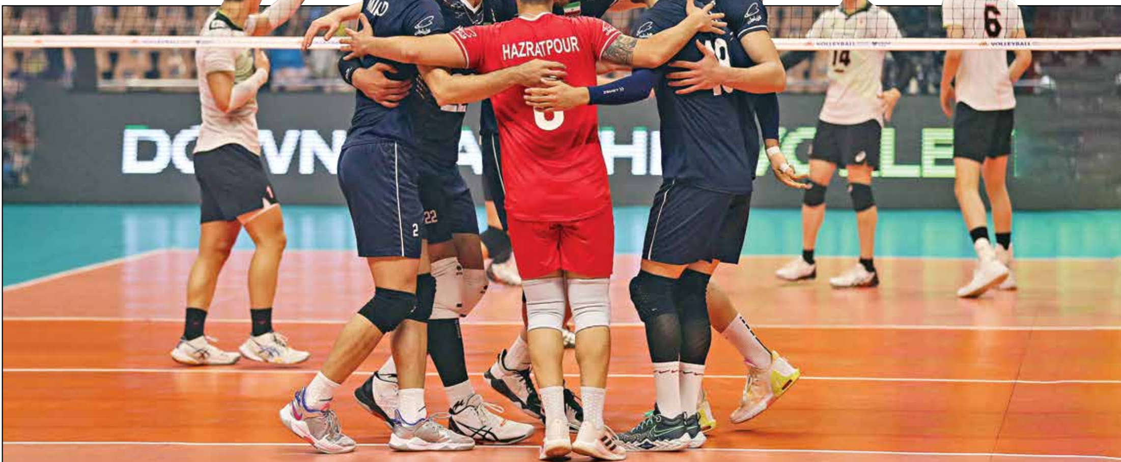
از باخت‌های والیبالی ناراحت نباشیم!