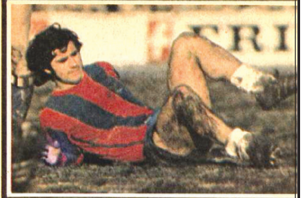
بولر سکنکوتی ترین و ناانتصابترین بازیکن با ریسک است. او در هر بازی در زمین حاضر میشود حتی اگر ریسک با ریسک یک لعن زار واقعی شده باشد.