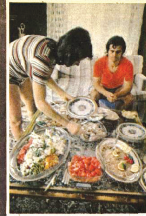
اوستی بولر برای راضی کردن شکم کرمبولر خیلی بول سکورد، اما خیلی باسلفه و کدبانو هم هست. کرمبولر هم غذای خوب میخواهد و هم زیاد. او همیشه اشتباهای خوبی دارد