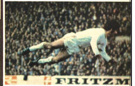
با دوش خوشش نیاید که مردان بوی بلند داشته باشند اما بولر سکویید برای فریب زدن با سر بهتر است بوی بلند باشد.