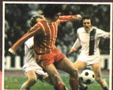
سخت ترین توپ ها را در برابر سنج ترین حرفه ای ها با سینه مهار میکنند و بعد با پای چپ یا راست جانش می اندازند. در اول عتاب تیز و بسیار دقیق است.