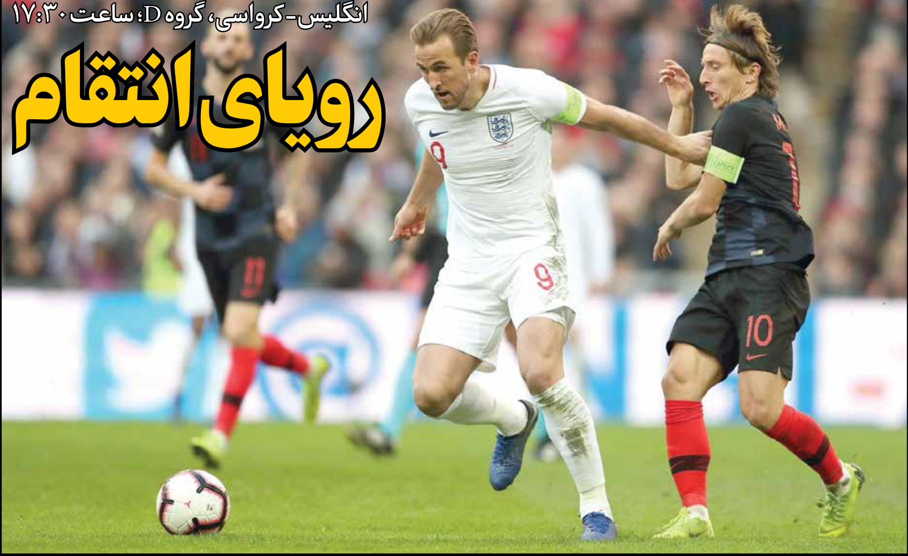
آخرین دیدار دو تیم در یورو در سال ۲۰۰۴ بود که انگلیس ۴ بر ۲ پیروزی رسید.

هلند در اولین بازی تدارکاتی خود مقابل ایرلند شمالی و قبرس را بدون گل خورده و با پیروزی به پایان برد. مردان آذری شو چنگو البته در شش بازی قبل تر آن‌را نتوانسته بودند دروازه‌شان را بسته نگه دارند و به این ترتیب این مهاجم