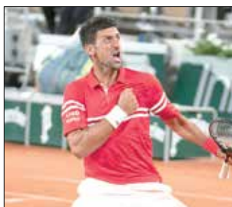
امروز، فینال اوپن فرانسه نوله، تاج‌را از سر نادل انداخت

در مسابقه‌ای که خیلی‌ها از همین حالا آن را بهترین بازی تاریخ تنیس نامیده‌اند، مرد شماره یک رنکنینگ این رشته نواک جوکوویچ سلطان زمین‌های رسی راقتل نادل را از تخت پادشاهی‌اش پایین آورد تا نواک قهرمانی‌های متوالی رقیب اسپانیایی‌اش قطع شود. در نبردی تماشایی میان دو تن از برترین تنیسورهای تاریخ، مرد ۳۴ ساله صرب با وجود آنکه ست اول مصافش مقابل مرد شماره ۲ تنیس جهان را با نتیجه ۶ بر ۳ باخت بود، ست‌های بعدی را با نتیجه ۶ بر ۷، ۶ بر ۶، ۲ بر ۰ و در دو ست دومین فینالیست به بازی پایانی دومین گرنداسلم فصل صعود کرد. به این ترتیب جوکوویچ در پایان این مصاف ۴ ساعت و ۱۱ دقیقه‌ها موفق شد از صعود نادل به فینال رولان گاروس برای ششمین سال متوالی جلوگیری کند. نادل در حالی با اولین فرانسه‌خداحافظی کرده‌کند که پیش از این در هر ۲۶ بازی‌اش در مرحله نیمه نهایی این رقابت‌ها پیروز بوده‌است.