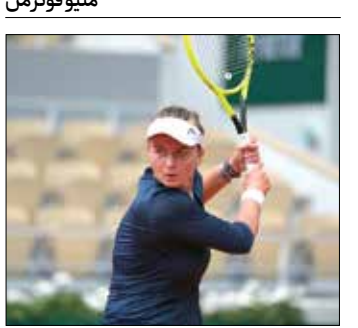
امروز، فینال اوپن فرانسه در بخش زنان