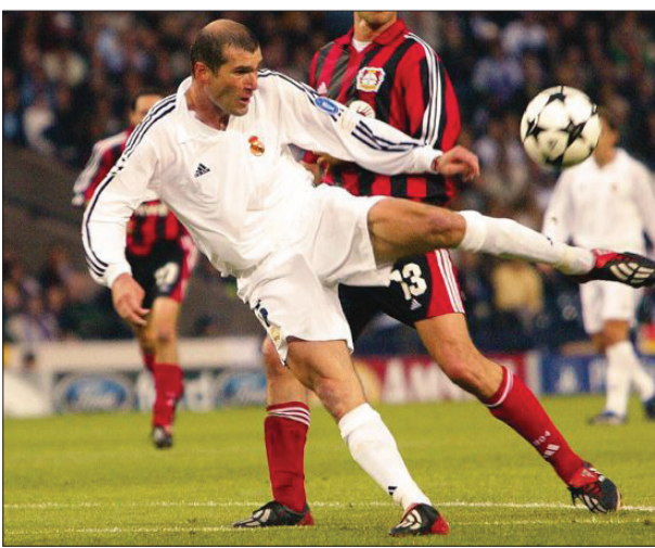
زیدان یکی از تکنیکی‌ترین بازیکنان تمام تاریخ فوتبال است

جز مهاجم یوگسلاو. این اولین جام رئال در لیگ قهرمانان امروزی بود. او در مدت حضورش یک لالیگا، یک سوپرکاپ و یک جام بین قاره‌ای را هم برد. بهترین بازیکن خارجی لالیگا در فصل ۹۶-۱۹۹۵ شد و نفر دوم لیست توپ طلای ۱۹۹۷.