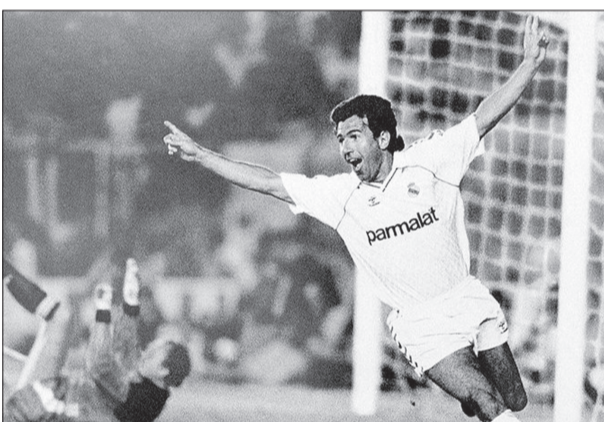
خوانیتو که بین سال‌های ۱۹۷۷ تا ۱۹۸۷ در رئال بازی کرد به شدت تکنیکی بوده

خوانیتو در ۲۸۴ بازی لالیگایی ۸۵ گل برای رئال مادرید به ثمر رساند. در مورد او که بین سال‌های ۱۹۷۷ تا ۱۹۸۷ برای رئال بازی می‌کرد گفته می‌شود به شدت تکنیکی بوده. او در روز اول حضورش در رئال در مصاحبه‌ای گفت: «بازی برای رئال مثل لمس آسمان است. رئال مادرید همیشه انتخاب اول من برای بازی بود.» خوانیتو در مادرید به ۵ قهرمانی لالیگایی رسید و ۲ بار هم جام یوفا را بالای سر برد. او در سن ۳۷ سالگی بر اثر تصادف با ماشین جانش را از دست داد.