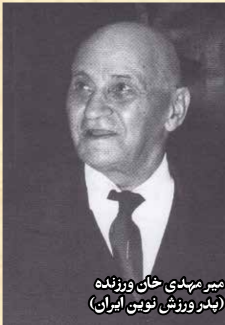
میرمهدی خان ورزشنده (پدر ورزش نوین ایران)