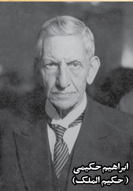
ابراهیم حکیمی (حکیم الملک)