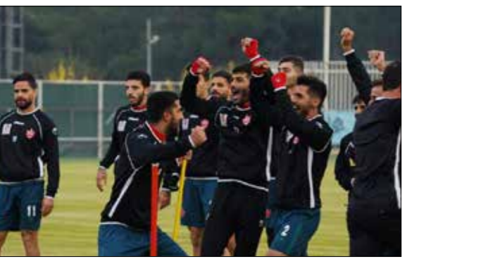
بازیکنان ذخیره و جوان های پرسپولیس در تمرین و بازی های درون تیمی که پر از کریخوانی و کل کل است انظوری شاد می کنند و روحیه شان را بالا می برند.