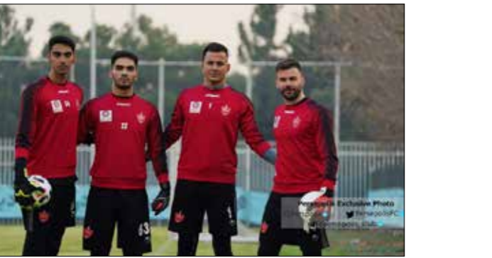
گلرهای پرسپولیس با این عکس اتحاد و دوستی شان را به تصویر می کشند. غیر از لک و رادشویچ، گلخواه و گلری که تازه از تیم های پایه آمده در تمرینات حضور دارند.