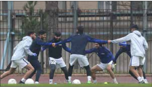
بازیکنان استقلال برای اینکه انگیزه خود را برای پیروزی مقابل صنعت نفت آبادان به رخ بکشند همان ابتدای بازی حلقه اتحاد زدند. تمرین استقلال در اوج شادابی شروع شد و در اوج شادابی هم به پایان رسید.