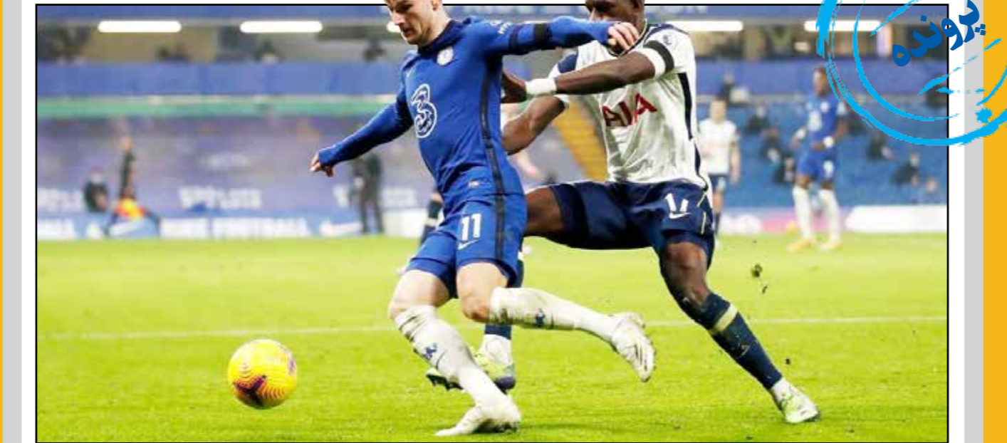
تساوی استاد و شاگرد در شب کم‌روح استمفوردبریج