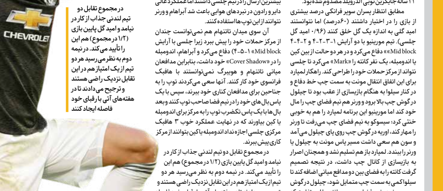
در مجموع تقابل دو تیم لندن‌ای جذاب از کار در نیامد و امید گل پایین بازی (۱/۲ در مجموع) هم در این دیدار تأیید می‌کند. در نیمه دوم به نظر می‌رسد هر دو تیم از یک امتیاز هم در این تقابل نزدیک راضی هستند و ترجیح می‌دادند تا در هفته‌های آتی با رقابتی خود فاصله ایجاد کنند

لیمبار تیمش را با آرایش ۳-۳-۴ به میدان فرستاد و ترجیح داد کای هورتز، ستاره گران قیمت آلمانی‌اش را نیمکت‌نشین کند. مورینیو هم با همان ۳-۳-۴ همیشگی شاگردانش را روانه میدان کرد و تنها در قلب خط دفاع یک تغییر اجباری اتفاق افتاده بود؛ جورادون ۲۳ ساله جایگزین تویی آدریولید مصوم شده بود. مطابق انتظار پسران سوپر فرانکی درصد بیشتری از بازی را در اختیار داشتند (۶۰ درصد) اما نتوانستند امید گلی به اندازه گل یک خلق کنند (۹۶٪ - امید گل جلسی). تیم مورینیو با دو آرایش ۳-۳-۴ و ۴-۳-۲ Mid block «م» دفاع می‌کرد و در هر دو حالت از بین کین اندومبله، یک نفر کاتنه را «Marki» می‌کرد تا جلسی نتواند از مرکز حملات خود را طراحی کند. راهکار لیمبار برای این اتفاق انتقال مورنت به سمت خط دفاع و در کنار سیلوا به هنگام بازسازی از عقب بود تا جیولول در گوش چپ بالا برود و برنامه هم نیم فضای چپ را مال خود کند اما مورینیو این برنامه لیمبار را هم به خوبی خنثی کرد؛ سوسوکو به نیم فضای چپ می‌رفت تا ورتر را مهار کند، اوریبه در گوش چپ روی پای جیولول می‌آمد و سون هم سعی داشت مسیر پاس مورنت به جیولول را ورتر را ببندد. لیمبار باز هم تسلیم نشد و همچنان اصرار می‌نمود که بازسازی از کمال چپ باشد. در نتیجه تصمیم گرفت کاتنه را به فضای بین دو مدافع میانی اضافه کند تا سیلوا کمی به سمت چپ متمایل شود، جیولول در گوش چپ و ورتر در نیم فضای چپ بمانند، با این تفاوت که