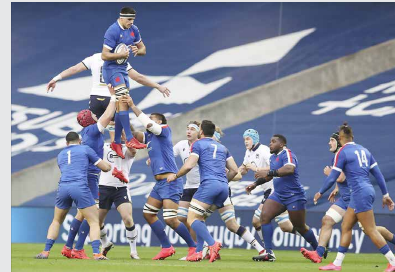
رگبی از آن دست ورزش‌هایی است که در ایران محجوب‌بافی مانده. رشته‌ای که به دلیل عدم حمایت رسانه‌های حتی خیلی‌ها نمی‌دانند در ایران هم وجود دارد و آن را ورزش تنه‌دار فیلم‌های هالیوودی تصور می‌کنند. این ورزش که در دنیا به چند روش کاملاً مختلف بازی می‌شود، همیشه شاهد صحنه‌های جذابی است. بخصوص هنگام ضربه‌اوت که کاملاً با ورزش‌های دیگر متفاوت است. در تصویر بالا مسابقات بین المللی جام پاییز رگبی را تماشا می‌کنید و مسابقه بین اسکاتلند و فرانسه در روز شنبه گذشته آیدنیروی اسکاتلند.