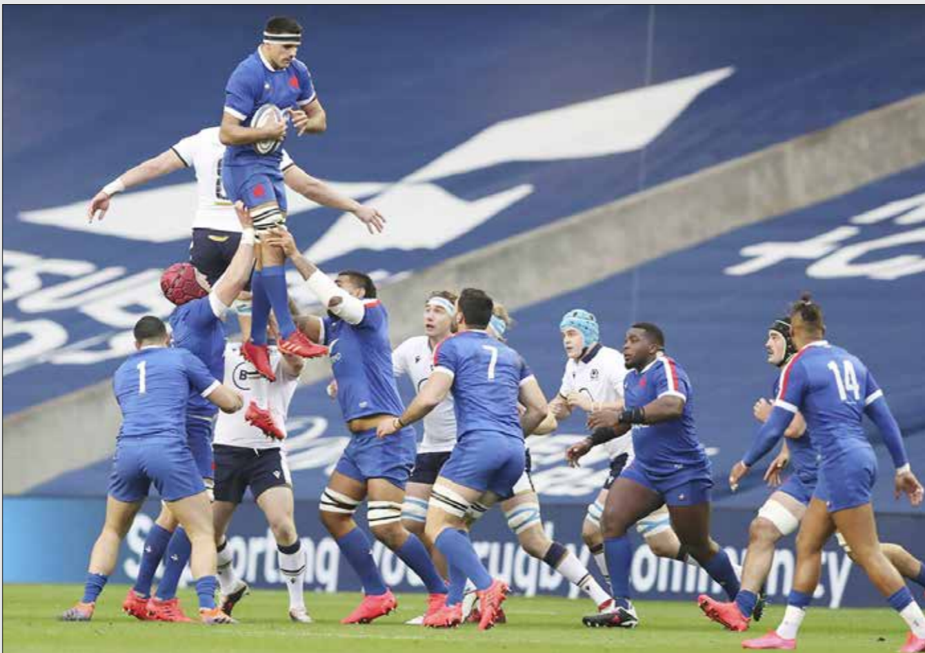
رگبی از آن دست ورزش‌هایی است که در ایران محجوب‌بافی مانده. رشته‌ای که به دلیل عدم حمایت رسانه‌های حتی خیلی‌ها نمی‌دانند در ایران هم وجود دارد و آن را ورزش تنه‌دار فیلم‌های هالیوودی تصور می‌کنند. این ورزش که در دنیا به چند روش کاملاً مختلف بازی می‌شود، همیشه شاهد صحنه‌های جذابی است. بخصوص هنگام ضربه‌اوت که کاملاً با ورزش‌های دیگر متفاوت است. در تصویر بالا مسابقات بین المللی جام پاییز رگبی را تماشا می‌کنید و مسابقه بین اسکاتلند و فرانسه در روز شنبه گذشته آیدنیروی اسکاتلند.