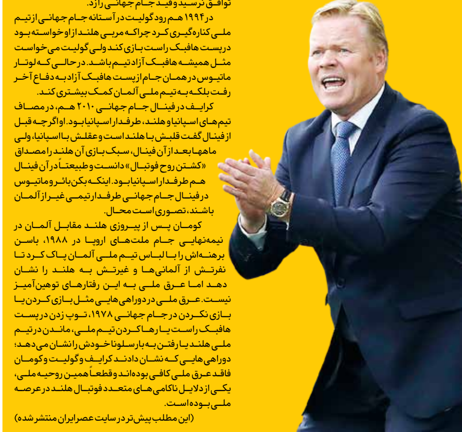
(این مطلب پیش‌تر در سایت عصر ایران منتشر شده)

اینکه کومان در اوج عملکرد خودش در تیم ملی هلند، بدون اینکه با هلند لااقل در یک تورنمنت شرکت کند، راهی بارسا شد، البته در تاریخ فوتبال ملی هلند